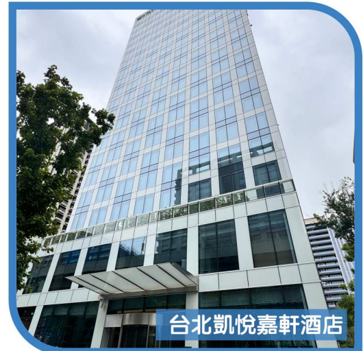
台北凱悅嘉軒酒店

【大稻埕河岸碼頭市集】結合美食、美酒、美景以及在地文創感，讓路過民眾在享受河岸風光之餘，還能在此休憩片刻。喝杯咖啡後，繼續下一段美妙旅程。