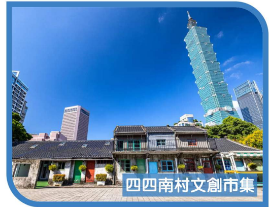
四四南村文創市集