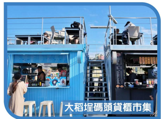
大稻埕碼頭貨櫃市集