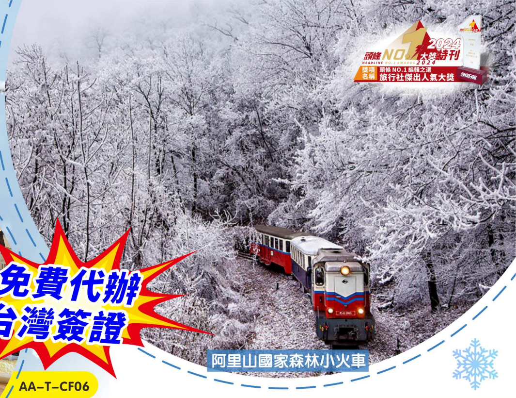
阿里山國家森林小火車