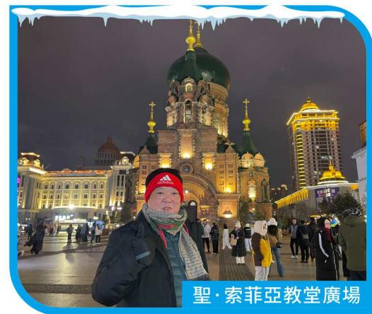
聖·索菲亞教堂廣場