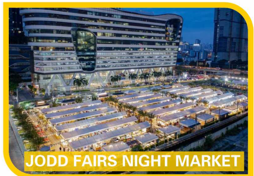
JODD FAIRS NIGHT MARKET

** 溫馨提示：行程圖片及資料僅供參考，行程內容、自費活動內容、酒店住宿、膳食、等會因應季節、天氣、交通或其他因素而有所變動，以當地實際安排為準**