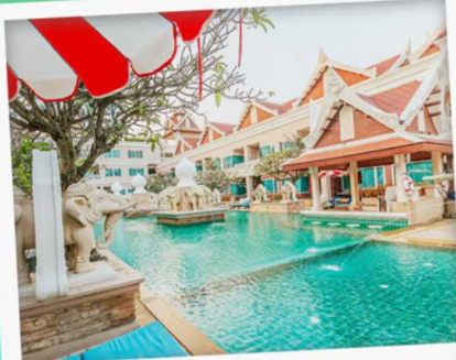
📍 Grand Pacific Sovereign Resort & Spa