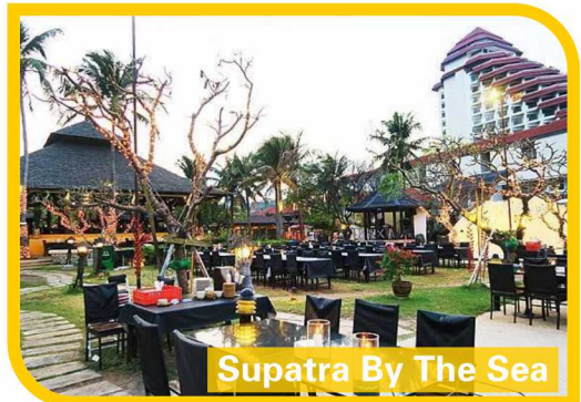
Supatra By The Sea

華欣夜市：華欣最著名夜市，設有小吃攤，販售服飾等商家，也有很多販售海鮮及各式海鮮燒烤的店家