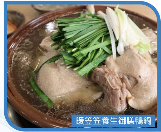
暖笠笠養生御膳鴨鍋

** 溫馨提示: 行程圖片及資料僅供參考, 行程內容、自費活動內容、酒店住宿、膳食、等會因應季節、天氣、交通或其他因素而有所變動, 以當地實際安排為準 **