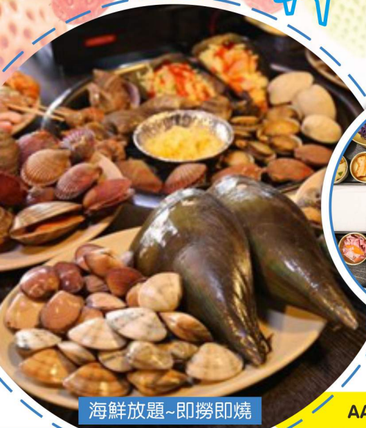
海鮮放題~即撈即燒