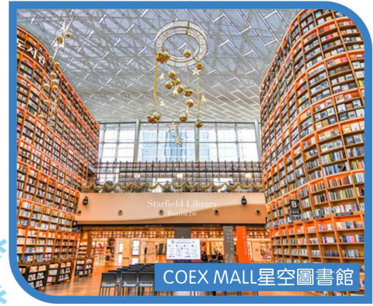
COEX MALL 星空圖書館