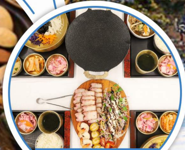
韓式拌飯+滋味鮑魚 +豚肉定食套餐