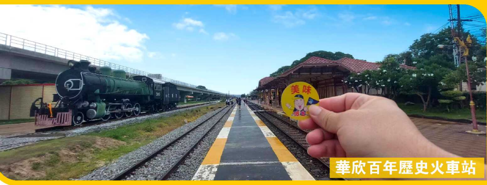
華欣百年歷史火車站