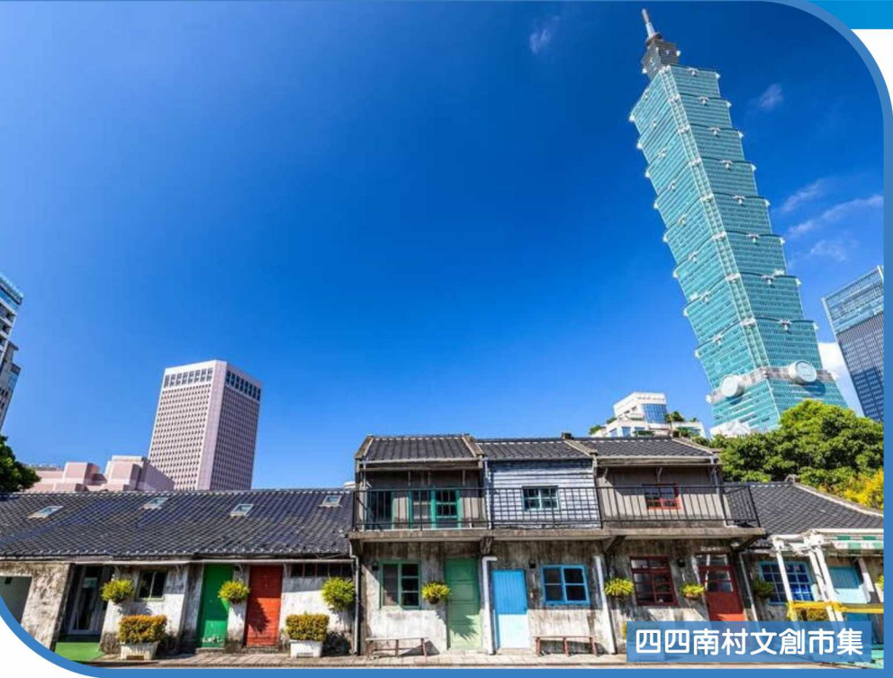
四西南村文創市集