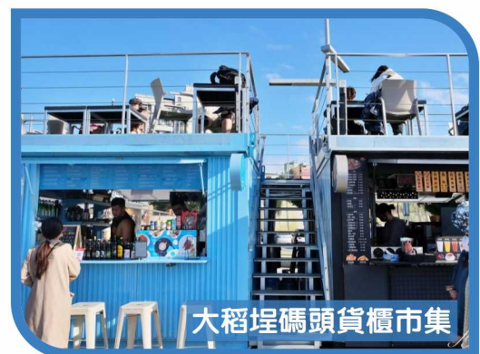
大稻埕碼頭貨櫃市集