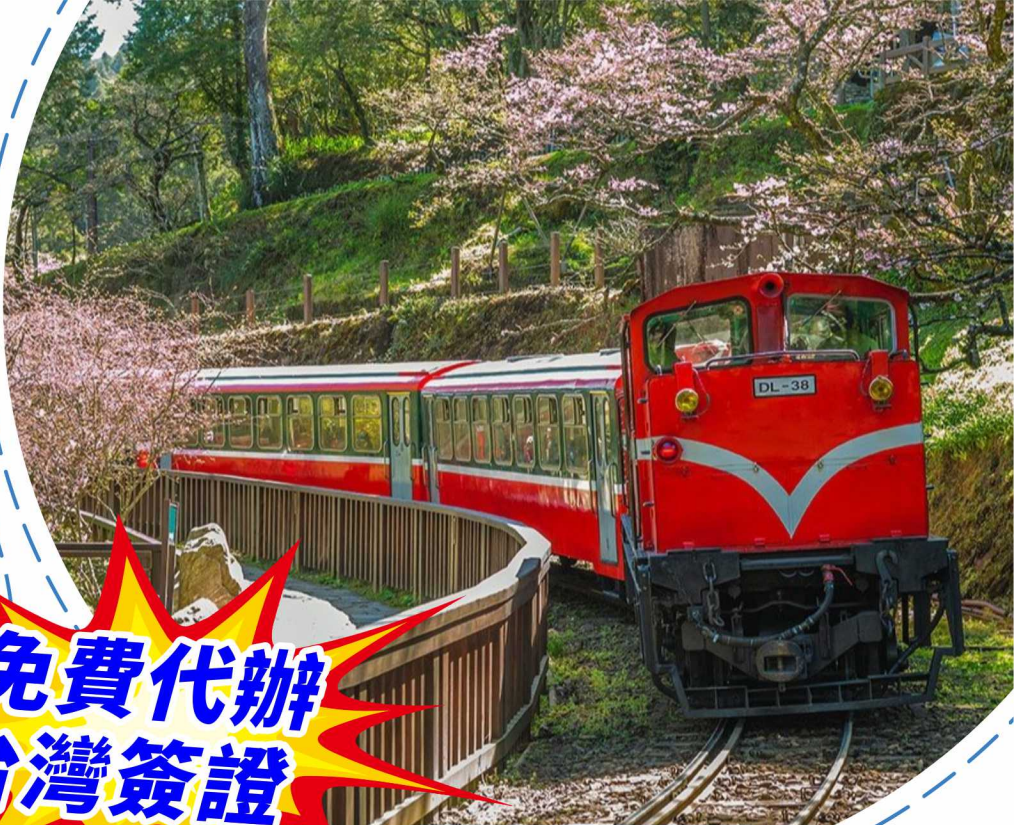
阿里山國家森林小火車