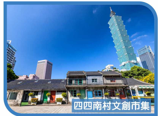
四四南村文創市集