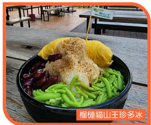
榴槤貓山王珍多冰