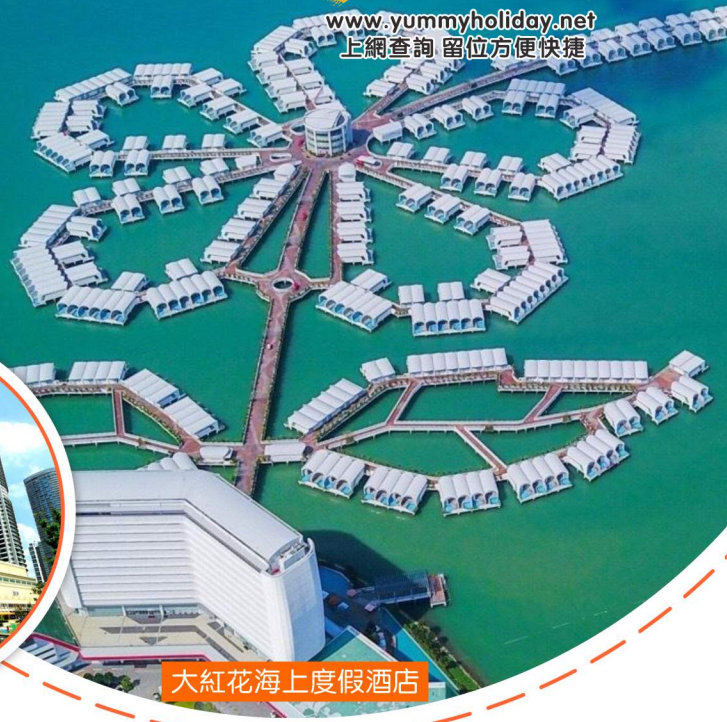
大紅花海上度假酒店